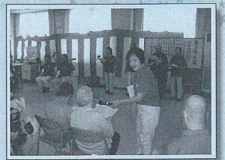
民謡ボランティア

また、特徴として病院と併設していることもあり、言語療法士による嚥下評価が適宜行われ、希望とされる経口摂取が実現できるように看介護職員が引き継ぎ支援しています。又、口腔ケアの大切さから、口腔ケア委員会が、平成21年度から看護師や介護福祉士